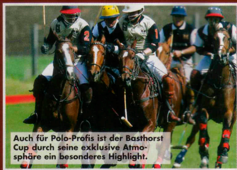
Auch für Polo-Profis ist der Basthorst Cup durch seine exklusive Atmosphäre ein besonderes Highlight.

WA-YO · Hofweg 75 · (040) 40 22 71 140 www.wa-yo.de